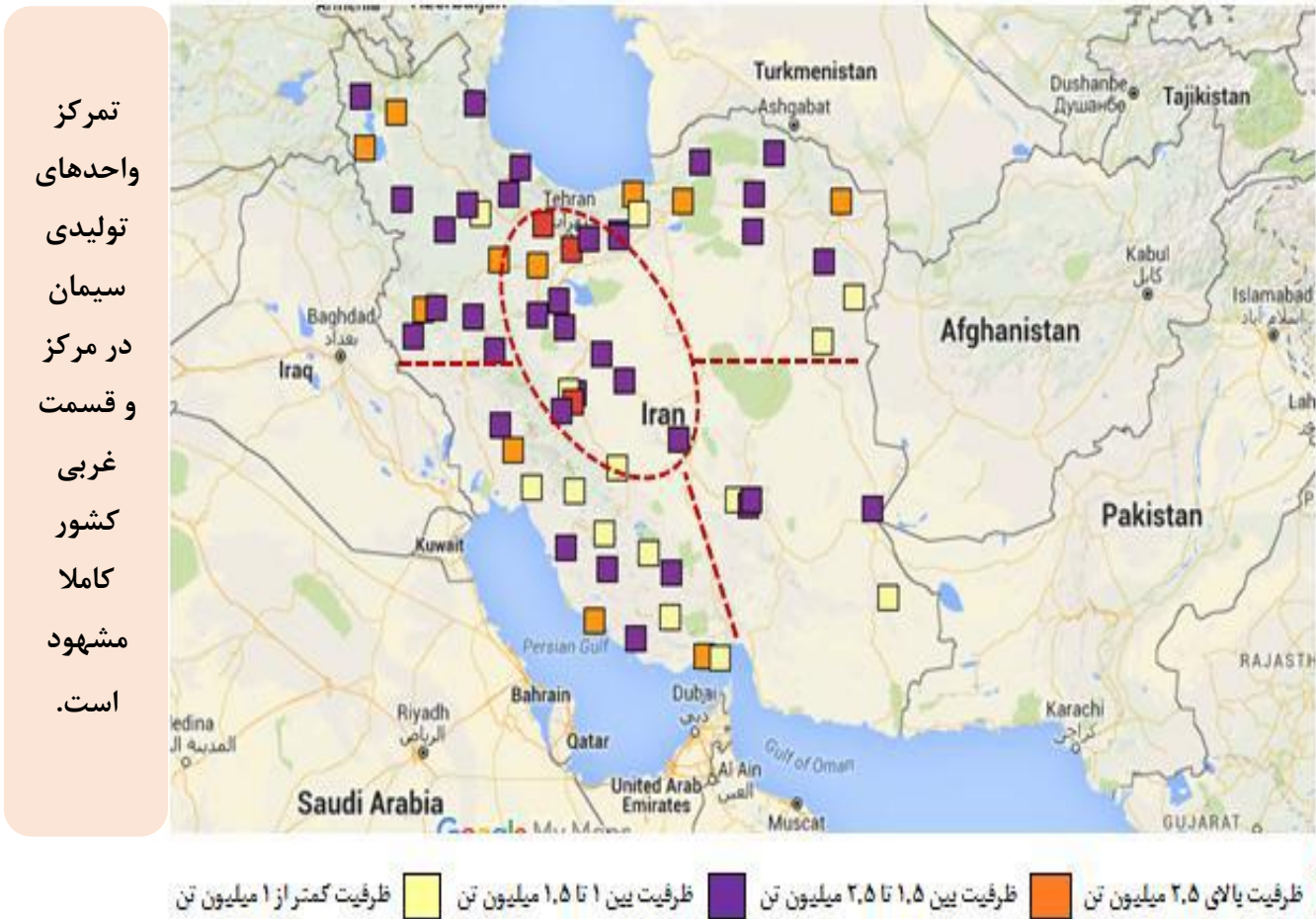
جانمایی واحدهای تولیدی سیمان در ایران

آمارها نشان می‌دهد که ایران در سال ۹۶ دارای ۷۵ کارخانه تولید کننده سیمان بوده است که با ظرفیت تولید ۸۵/۳ میلیون تن سیمان از نظر ظرفیت چهارمین رتبه را در کشورهای جهان بعد از چین و هند و آمریکا در اختیار دارد. طبق آمارها استان اصفهان با ۶ واحد تولیدی بیشترین ظرفیت را دارد. این استان بالغ بر ۷,۸ میلیون تن ظرفیت تولید سیمان را دارد و استان تهران و خراسان رضوی به ترتیب با ۷,۱ و ۶,۲ میلیون تن در رتبه‌های بعدی قرار دارند. استان فارس نیز با ۷ واحد تولیدی در مجموع از ظرفیت تولید ۵,۷ میلیون تن سیمان را برخوردار است.